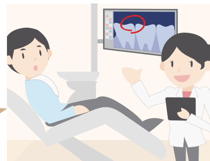
●インフォームドコンセントで