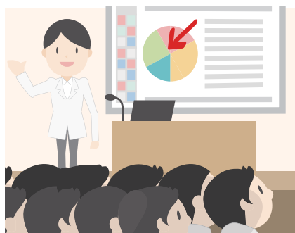
●プレゼンテーションで